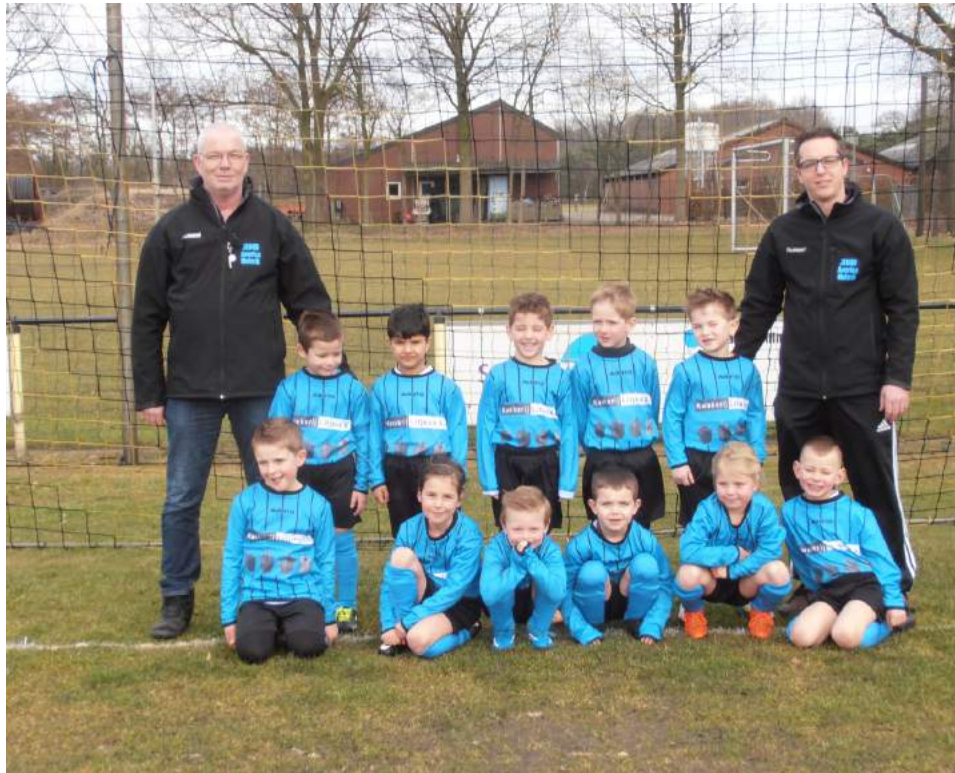
JO7 (Mini Pupillen)