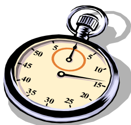
Aanvangstijden thuiswedstrijden zijn gewij-

we de dagindeling en de daarbij behorende speeltijden ingediend bij de KNVB.