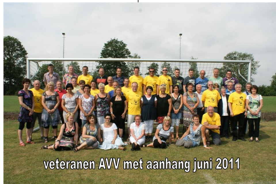
veteranen AVV met aanhang juni 2011

Een Belg loopt langs het strand. Als hij in het water een zwemmer in moeilijkheden ziet, springt hij er in en redt hem. De zwemmer zegt: "Hartelijk dank. Ik ben geen mens, maar een goede geest. U mag twee wenssen doen." "Da's mooi," zegt de Belg, "dan wens ik als eerste een fles jenever die nooit opdraakt." De geest geeft hem een fles jenever. De Belg drinkt er uit en als hij naar de fles kijkt, zit 'ie nog helemaal vol. "Dat is fantastisch!" roept de Belg uit: "Doe mij er nog maar zo een!"