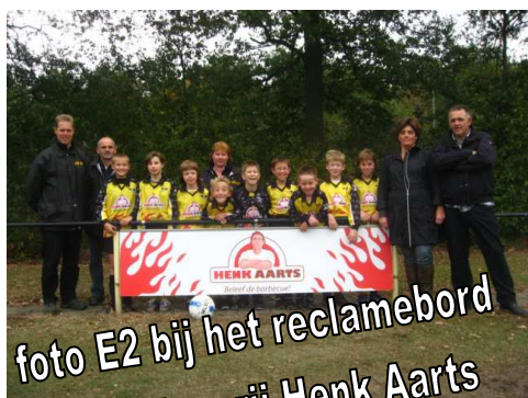
foto E2 bij het reclamebord van Slagerij Henk Aarts