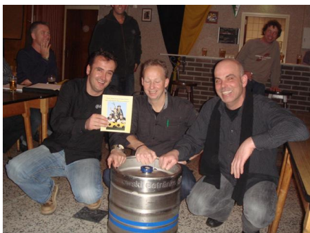
Het prinselijk trio had ook nog een belofte in te lossen.....