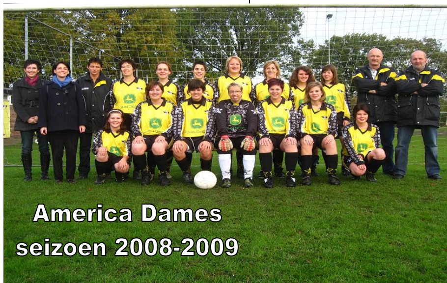
America Dames seizoen 2008-2009