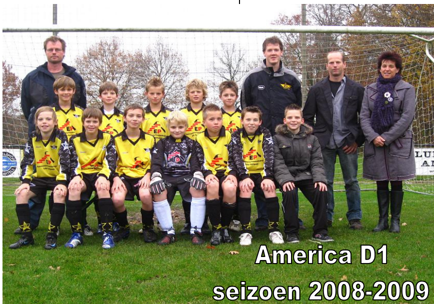
America D1 seizoen 2008-2009