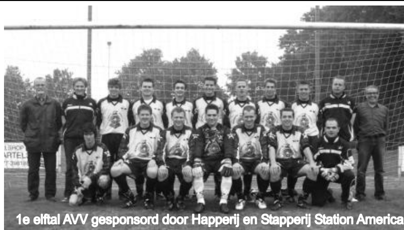
1e elftal AVV gesponsord door Happerij en Stapperij Station America

Zie rechts het krantenartikel uit het toenmalige Dagblad voor Noord Limburg (van woensdag 28 april 1971).