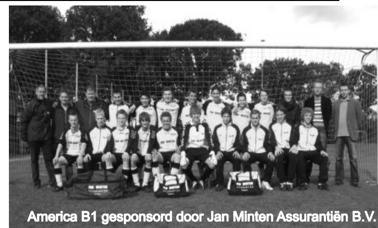
America B1 gesponsord door Jan Minten Assurantiën B.V.

Beslissingen in afdelingsvoetbal gaan vallen