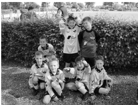
Een trots F2 team met hun bokaal..