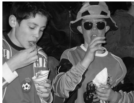
2 echte fans van Jong Oranje.....