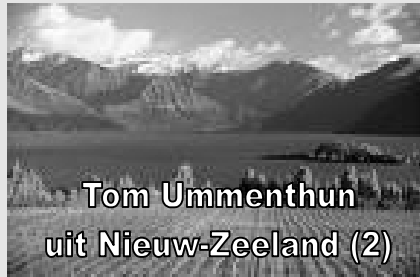
Tom Ummenthun uit Nieuw-Zeeland (2)